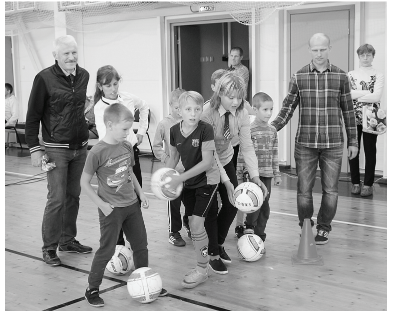
День открытых дверей в ФОКе «Заря» прошел весело и с пользой.

Хорошее показательное выступление подготовили юные самбисты. Они не только демонстрировали борцовские приёмы, но кувыркались, делали сальто, стараясь показать, на что способны. Выступали с азартом - за ними то и дело приходилось поправлять маты.