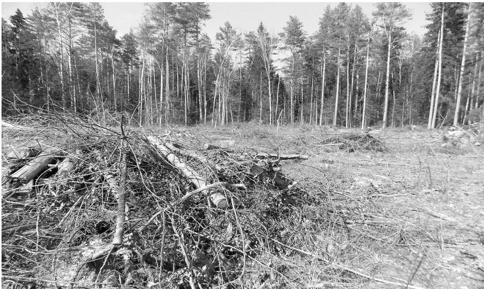
Зима прошла, а лесосека осталась захламленной.